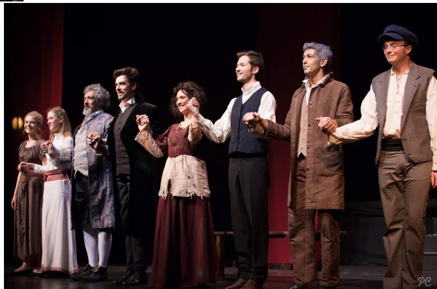
Les acteurs de la pièce.